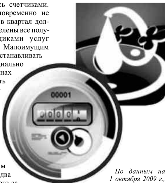
По данным на 1 октября 2009 г., совокупная задолженность за услуги ЖКХ в РФ составляла 333 млрд рублей.

В то же время остается норма, по которой жильцы могут не платить за некачественные услуги вроде чуть теплой воды или холодных батарей. Зафиксировать брак можно будет специальным актом, подписанным свидетелями.