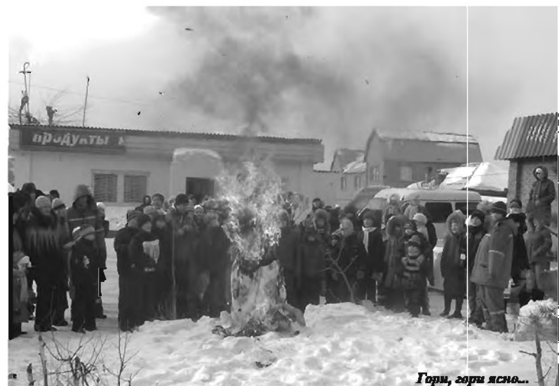
Гори, гори ясно...