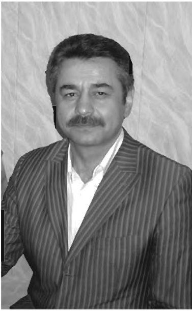
Таджики и в Сибири имеют право выбора в парламент республики.

Более двух часов длилась очередная в этом году встреча представителей таджикской диаспоры за круглым столом в ДТиС. О том, какие поднимались вопро-