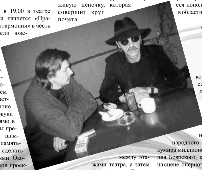
... между этажами театра, а затем плавно перетечет в зал. В мод-

ном показе украшений и одежды на сцене будут участвовать известные красноярцы. Все собравшиеся пополнят багаж знаний в области моды и красоты.