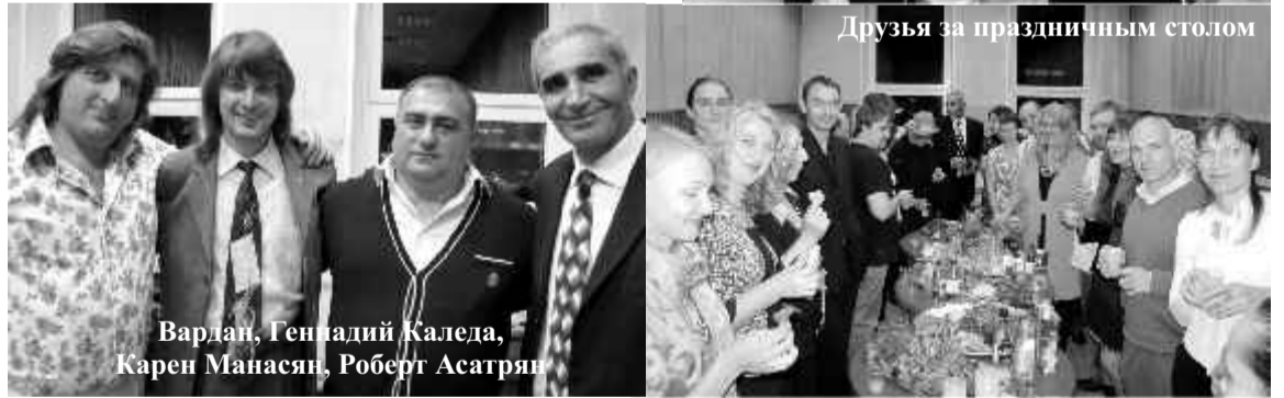
Друзья за праздничным столом