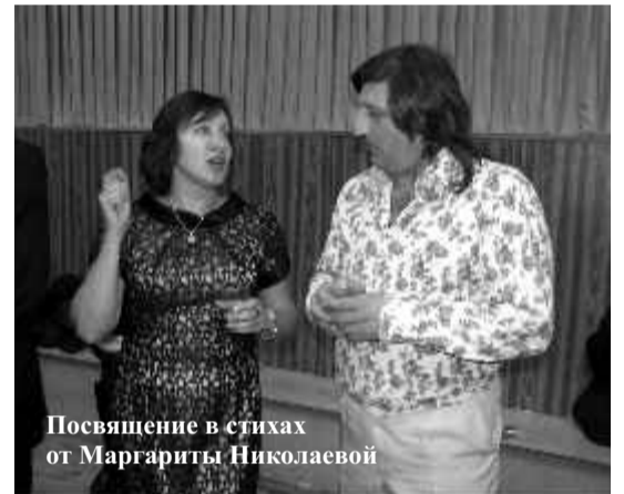
Посвящение в стихах от Маргариты Николаевой