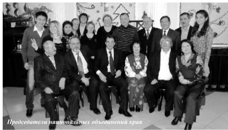
Председатели национальных объединений края