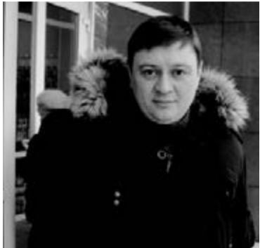
Министр ЖКХ Андрей Резников

Об этом шла речь на селекторном совещании с главами городов и районов Красноярского края, организованном министерством жилищно-коммунального хозяйства.