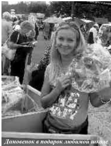
Домовенок в подарок любимой школе

истории Кировского района. Построена она в 1935 году. Тогда на правобережье было всего два кирпичных здания: Авиадом и сороковая школа, а вокруг – пустырь и поля картошки. Связь с центром города была весьма условной и не очень скорой: летом – по понтонному мосту, зимой – по льду через Енисей. Правда, была еще «мотаня» (мини-электричка от РайТЭЦ до Авиадом) и электропоезд «Ученик», который доставлял правобережных жителей в «город». В военные годы ученики занимались в три-четыре смены. Кроме того, на базе образовательного учреждения находилась вечерняя школа и начинал свою деятельность машиностроительный техникум. По тем временам школа № 40 была центром культурной жизни микрорайона – здесь располагались и кинозал, и клуб с