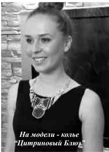
На модели - колье «Цитриновый Блюз»

ми, впервые представленными в Красноярске: «Золотой Век», «Рифеста», Адриа», с эксклюзивной коллекцией «Балет» и многими другими.