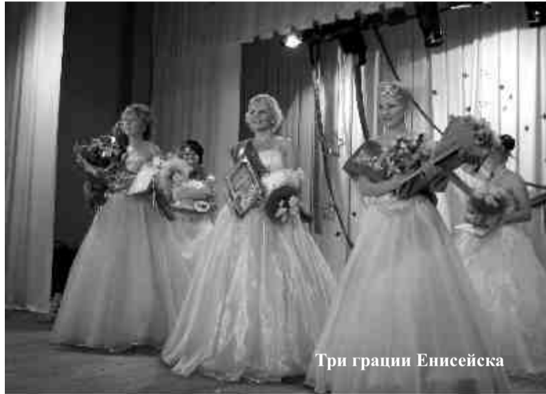
Три грации Енисейска

Это наука для тех, кто хотел, но пока не решился. Я уже провела беседы с пятью потенциальны-