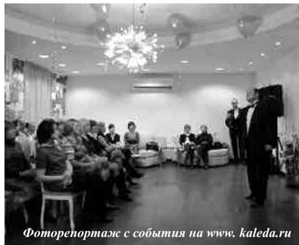
Фоторепортаж с события на www.kaleda.ru